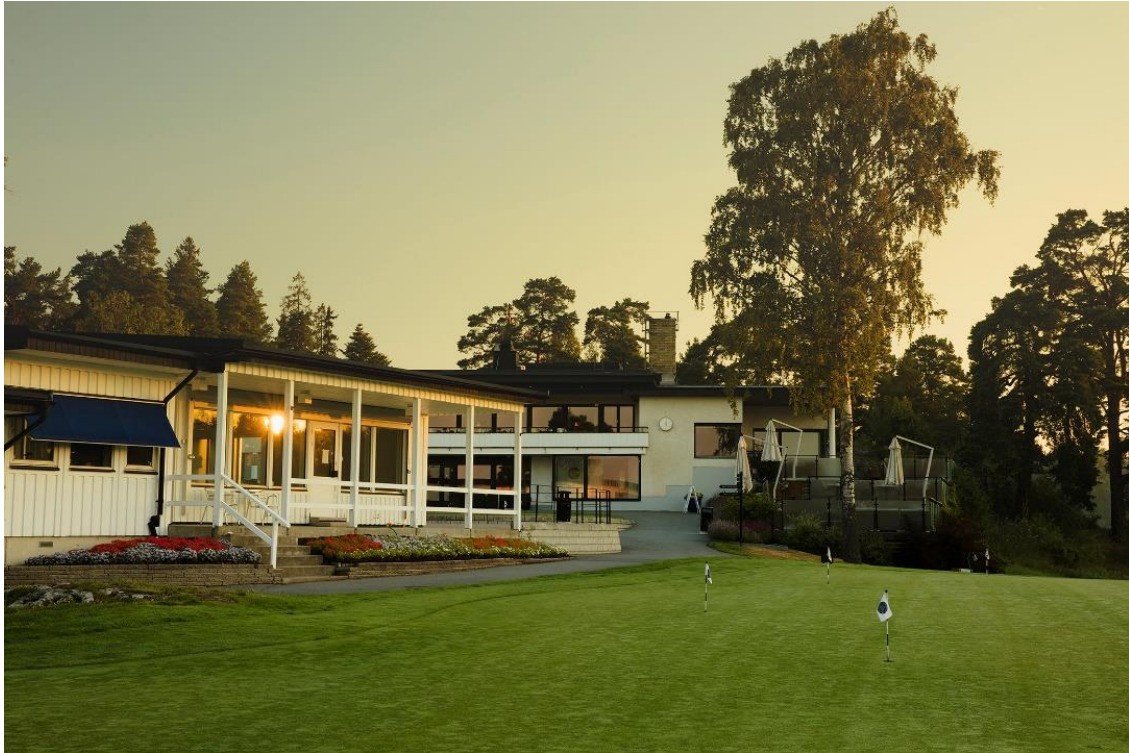
Klubbhusområdet en tidig morgon.