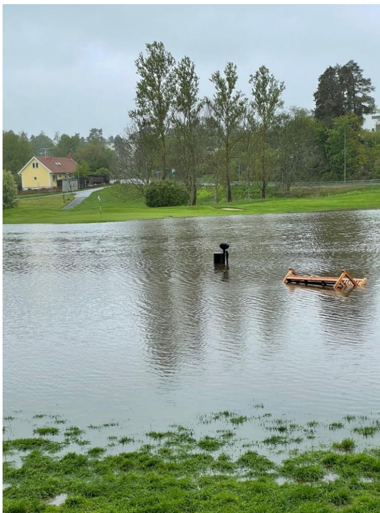
Dammen på 2:an svämmade över i maj och juni 2021.