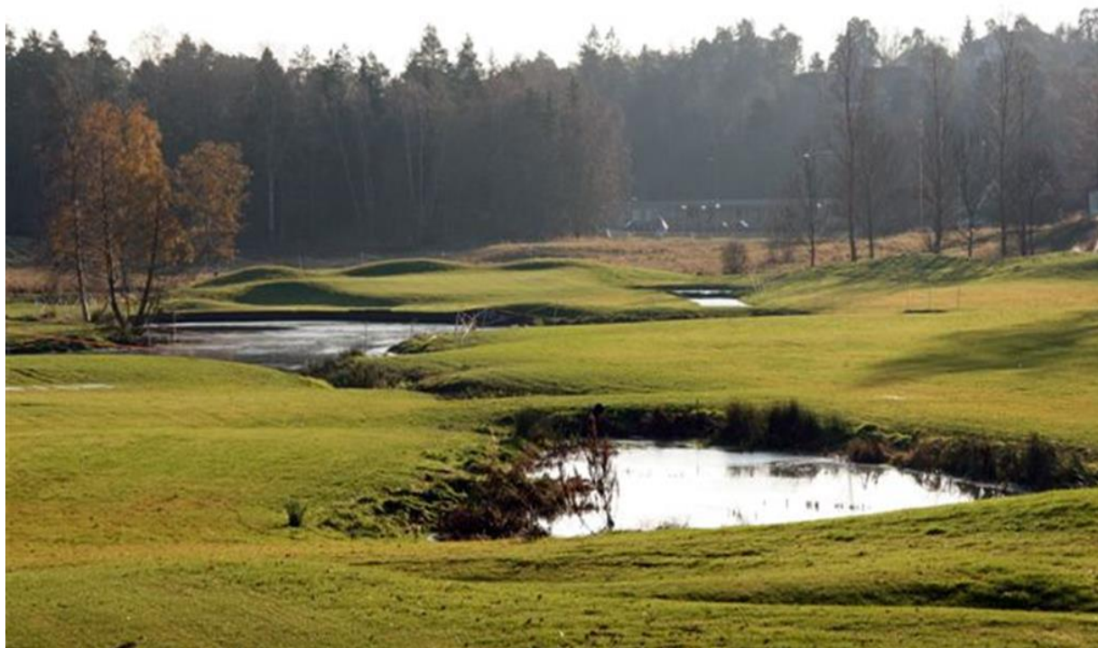
Dammarna mellan 2:an och 3:an med 2:ans green i bakgrunden.