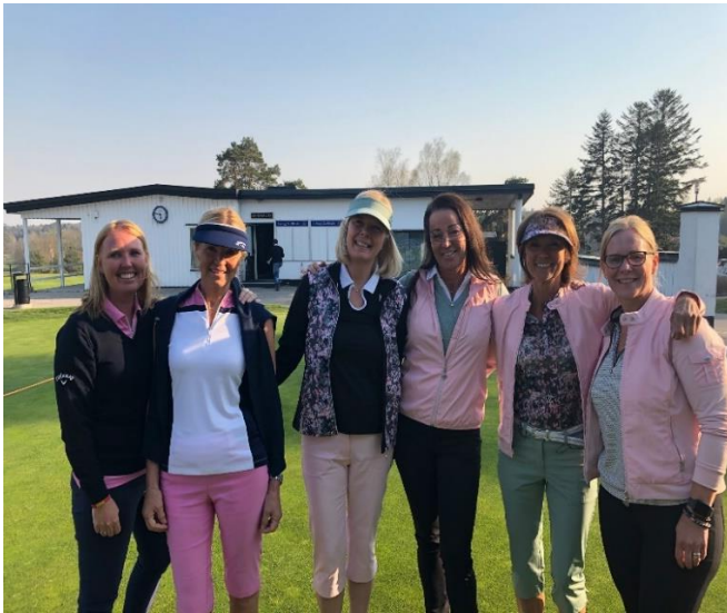
6 välklädda mannekänger från damernas årliga presentation av säsongens golfplaggsnyheter.

Dessa båda tävlingar avslutas med en gemensam middag och prisutdelning. Ladies Invitation är en tävling som har pågått i många år. Hälften av de startande är inbjudna damer från andra klubbar. Tävlingen har kanonstart och en efterföljande gemensam lunch.