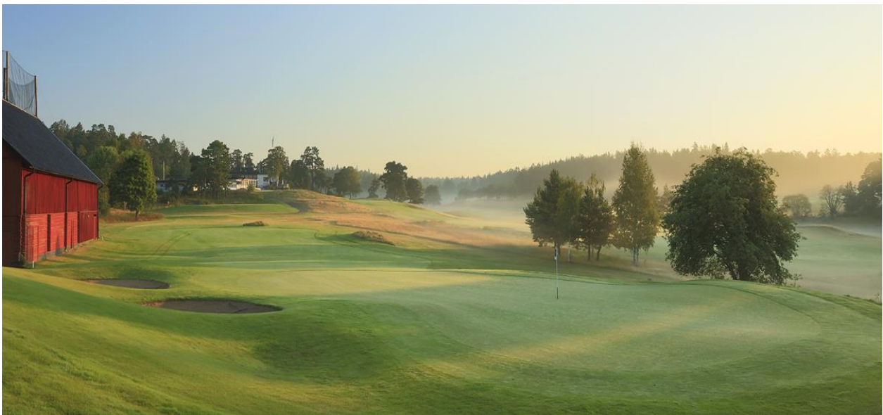
Fösta hålet med klubbhuset i fonden.

Robotgräsklippare inköptes för att sköta gräsytona vid entrén framför muren till klubbhusområdet.