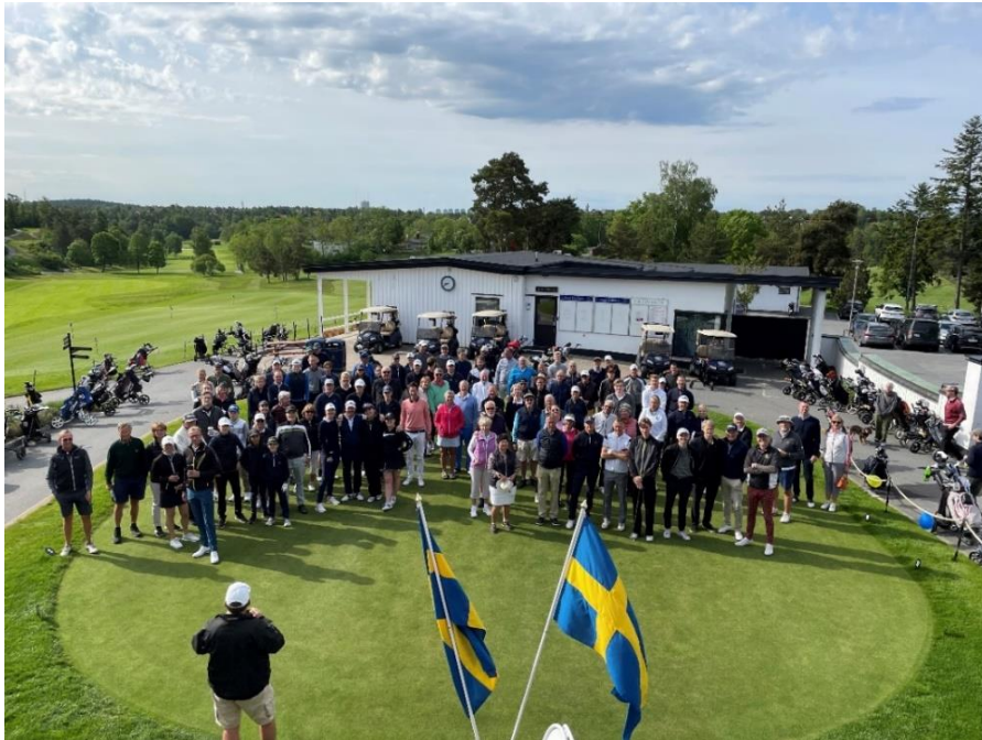
Samling inför den årliga klubb tävlingen "Grand Opening"

Det höga nätet till höger om 1:a hålet byggs om och höjs för att förhindra slicade utslag att hamna på Kyttingevägen.