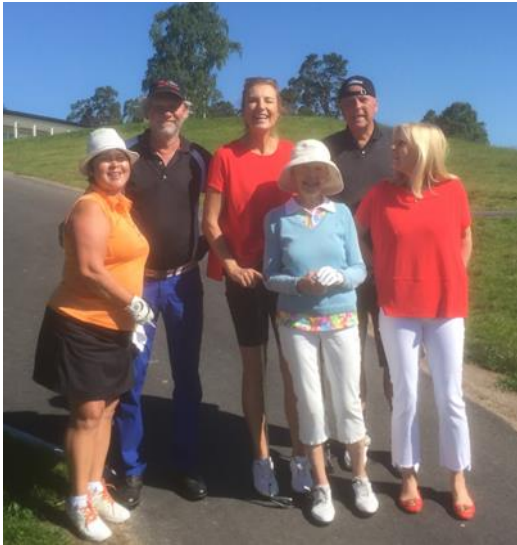
3 lag med laddade seniorgolfare på första tee.

Antalet tävlingsstarter hos seniorerna har de senaste åren varit det klart största bland klubbens alla sektioner. Säsongens c:a 23 tävlingar blev ofta fulltecknade.