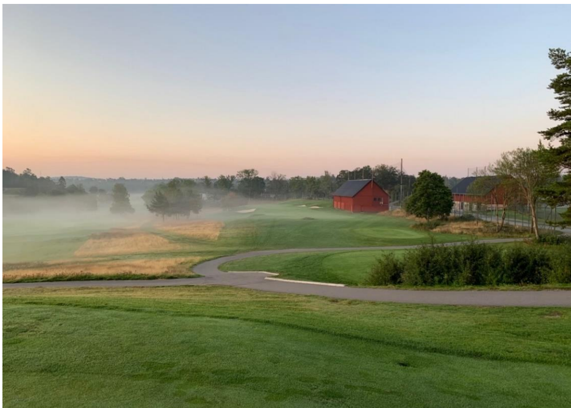
Vy över första hålet en tidig morgon.