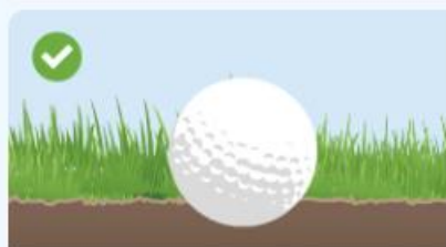
FIG. 16.3A: NÄR EN BOLL ÄR PLUGGAD

Bilden nedan illustrerar när en boll anses vara pluggad: